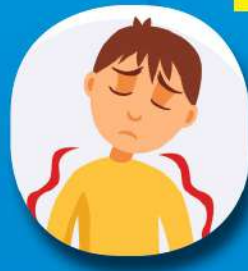
เหนื่อยหอบ