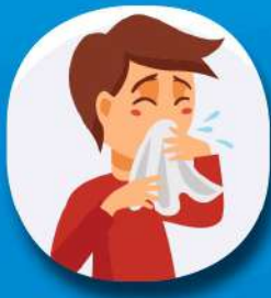
น้ำมูกไหล